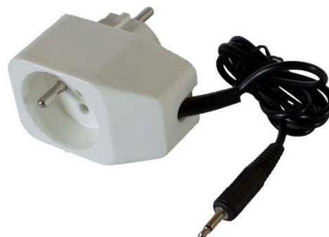
avec module lampe

FÉLICITATIONS pour votre achat du "Sonic Traveler L". Ce produit de qualité est conçu pour les personnes ayant besoin d'un réveil doté des fonctionnalités uniques.