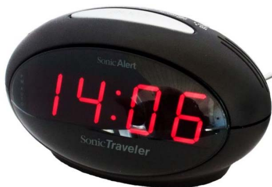
Sonic Traveler L